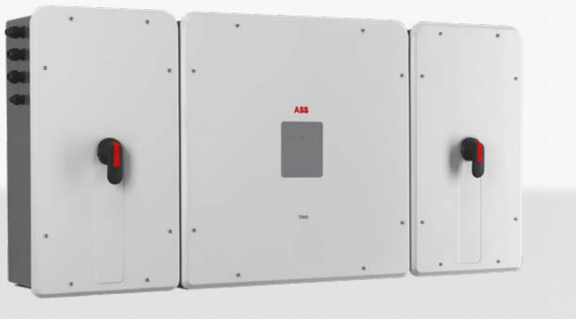
— TRIO-TM-50.0/60.0 inverter di stringa da esterno

Il nuovo modello della serie TRIO, con 3 MPPT indipendenti e potenza nominale fino a 60 kW, è stato progettato con l'obiettivo di massimizzare il ritorno di investimento in grandi impianti, sfruttando i vantaggi derivanti da una configurazione decentralizzata, con installazioni sia a tetto che a terra.